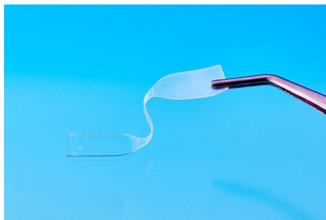
シート状に成型されたバイオ SIS

当社は、今後も独創的な技術・製品・サービスを通して、「持続可能な地球」と「安心して快適な人々の暮らし」に貢献してまいります。