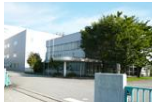
ゼオンメディカル研究所・工場