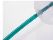
消化器用オフセットバルーンカテーテル