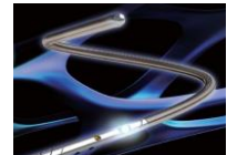
血管内圧測定用センサー付ガイドワイヤ