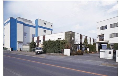
ゼオンオプトバイオラボ株式会社