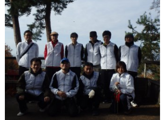
唐沢山のごみ拾い（通称：ムカデ退治）活動