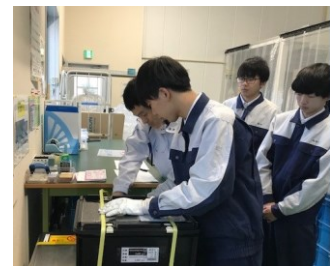
インターンシップ（製品梱包作業体験）