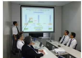
ISO 推進室ワーキンググループの 会議風景