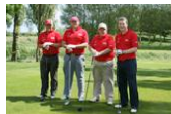
幼児癌チャリティーゴルフコンペ参加者たち

ZCEL は地域のさまざまな活動のスポンサーにもなっています。若者たちに救急蘇生法を指導しているホワイトモアベイ ライフセービングクラブには、訓練用具を提供しています。地域のサッカーチームやウェールズ幼児癌チャリティーが主催するゴルフコンペも支援しています。また、大学生の実習受け入れや高校生達の工場訪問にも積極的に協力しています。