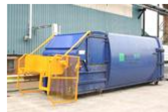
2012 年に場内に設置した廃棄物圧縮機

2012 年の主な活動は廃棄物の管理方法の改善です。すべての廃棄物は発生源を明確にするとともに分別回収します。回収したプラスチック等の廃棄物は、場内に設置した圧縮機にかけ容積を小さくしたのち、外部業者に処理を委託します。