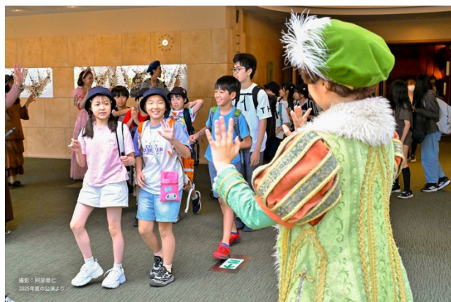
出演者による終演後のお見送り風景