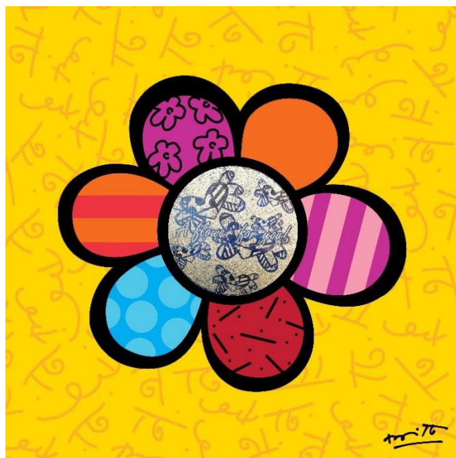
タイトル「CLASSIC FLOWER POWER」(制作:ロメロ ブリット氏)