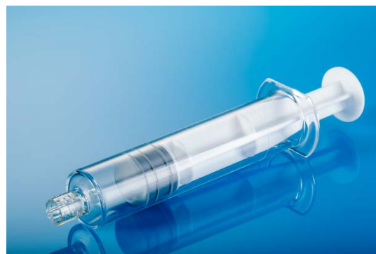
プレフィルドシリンジ(COP製)

本件に関するお問合せ先：日本ゼオン株式会社 広報室 TEL 03-3216-2747