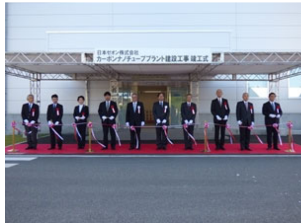
テープカットの様子