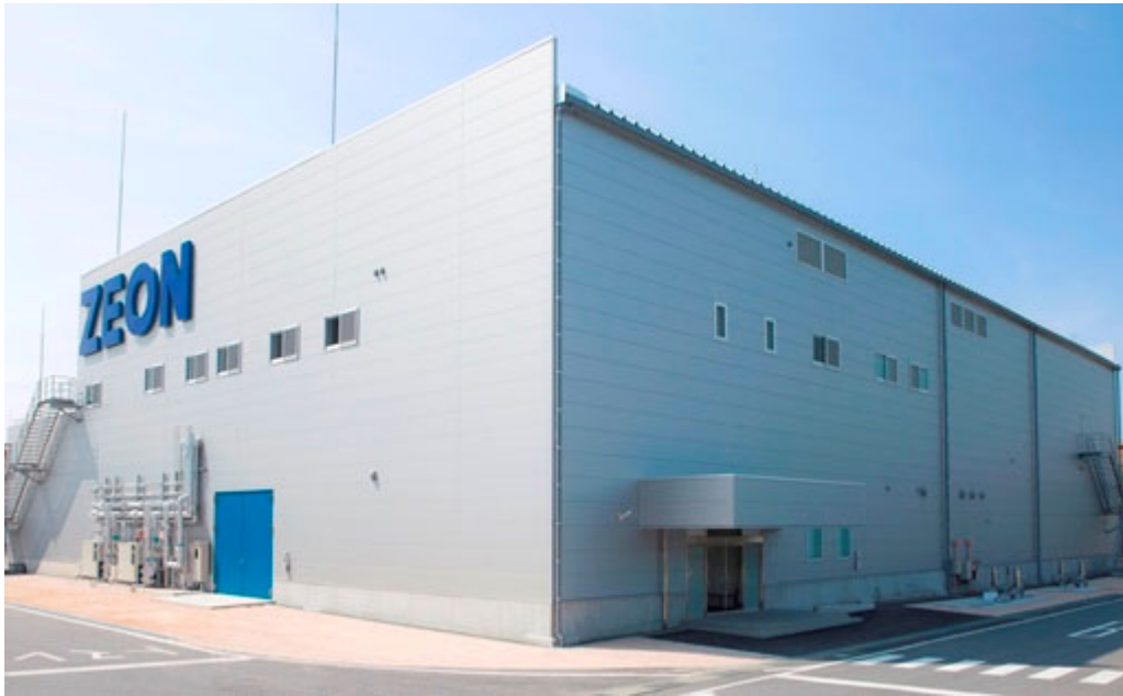
完成したスーパーグロース法カーボンナノチューブ工場