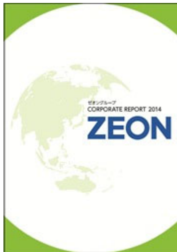
「ゼオングループ コーポレートレポート 2014」冊子版 表紙