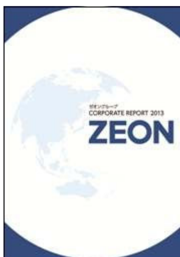
「ゼオングループ コーポレートレポート 2013」冊子版 表紙

なお、 Web版 には冊子版の内容に加え、環境・安全に対する取り組み、社員とのかかわりなどについて詳細に報告しております。