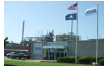
ケンタッキー工場

1989 年設立。当社は 1989 年に B.F.グッドリッチ・ケミカル社のエラストマー部門を買収し、同年米国テキサス州パサデナに建設した水素化ニトリルゴム工場を統合して設立されました。北米を中心に事業を展開し、ゼオンブラジルを拠点に南米にも事業を拡充しています。