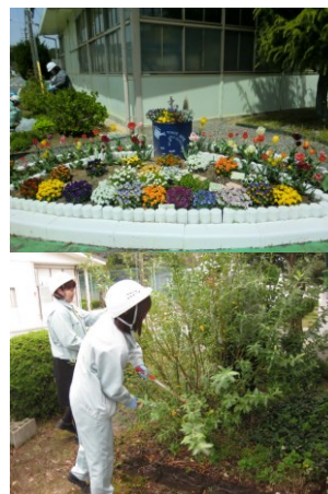
MD 委員会を中心に構内の緑化運動実施