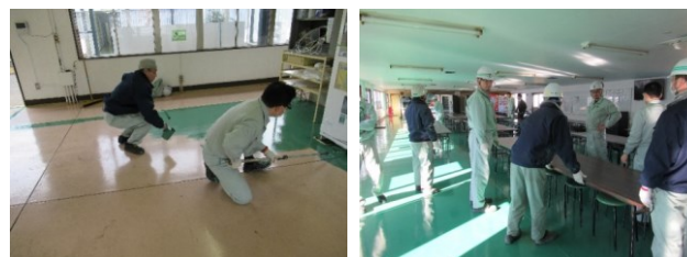
MD・たいまつ活動主催の改善(清掃・塗装)活動