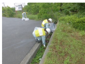
各所清掃活動の様子