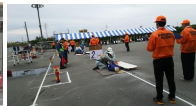
防災協会訓練競技会