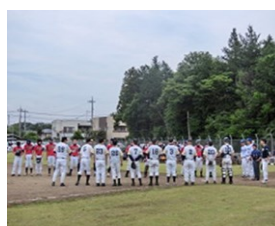
親善野球大会の様子