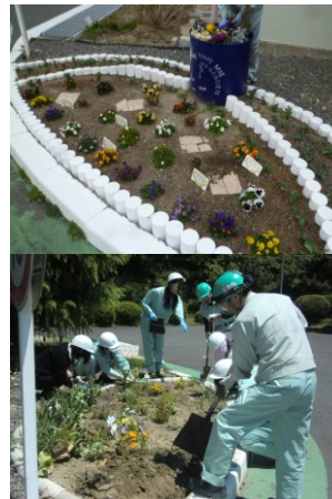
MD 委員会を中心に構内の緑化運動実施