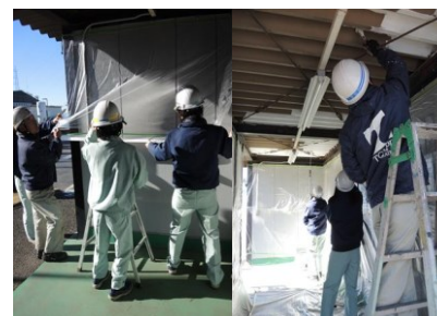
MD 委員会主催の改善(清掃・塗装)活動