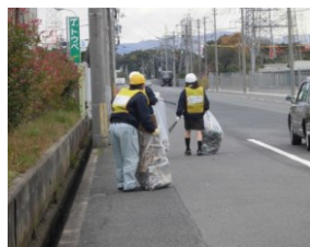
各所清掃活動の様子