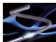
血管内圧測定用センサー付ガイドワイヤ