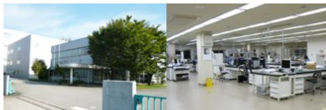
ゼオンメディカル研究所・工場