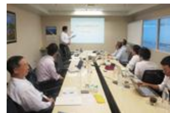
アセアン現地法人会議での法令研修風景