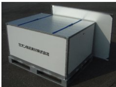
上蓋を外した状態