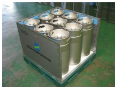
上蓋及び側板1枚を取り外した状態