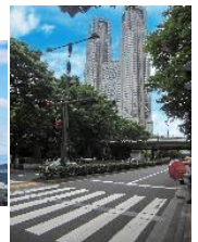
視覚障害者誘導標 示付き横断歩道