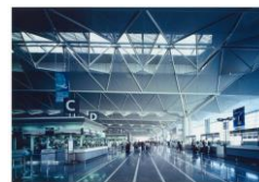
粉体塗料塗装 中部国際空港出発ロビー