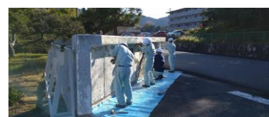
各部署やグループ主催の改善活動