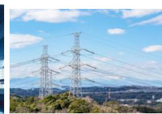
省工程弱溶剤ふっ素樹脂 塗装システム(送電鉄塔)