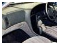
PSC を使用した自動車内装材