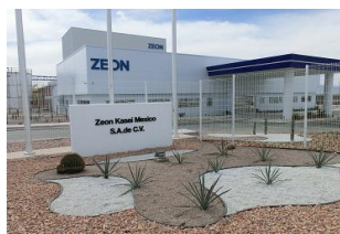
ZEON KASEI MEXICO S.A. DE C.V. 翁化成塑料（常熟）有限公司