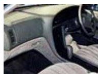
PSC を使用した自動車内装材