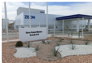
ZEON KASEI MEXICO S.A. DE C.V. 翁化成塑料（常熟）有限公司