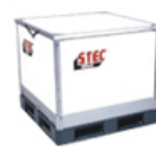
物流資材折りたたみコンテナ「STEC（ステック）」