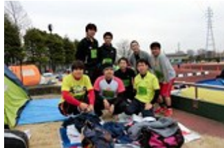
茨城工場マラソン大会の様子