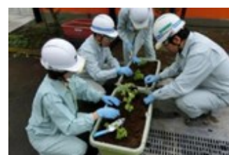
MD委員会を中心に構内の緑化運動実施 (グリーンカーテンの育成)