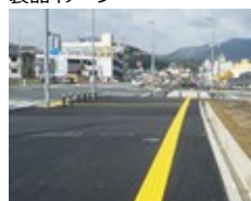
視覚障害者用誘導標示材 施工例