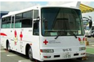
場内で献血活動中の献血車

茨城工場では、古河市工業会が主催するスポーツ大会や、古河市が主催するマラソン大会に参加し、地域交流を深めています。