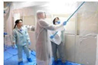
MD委員会主催の塗装活動