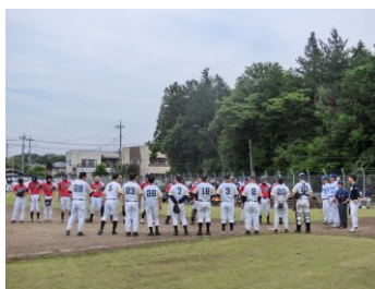
スポーツ大会の様子