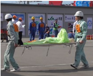
消防訓練大会の様子