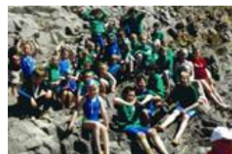
ホワイトモアベイ サーフライフセービングクラブの活動風景

ZCEL は地域のさまざまな活動のスポンサーにもなっています。若者たちに救急蘇生法を指導しているホワイトモアベイ サーフライフセービングクラブには、訓練用具を提供しています。地域のサッカーチームやウェールズ幼児癌チャリティーが主催するゴルフコンペも支援しています。また、大学生の実習受け入れや高校生達の工場訪問にも積極的に協力しています。