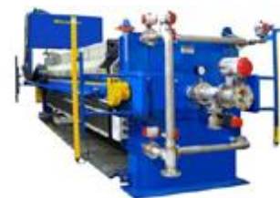
2014 年に場内に設置予定の水分圧搾機

2013 年からの主な改善活動は、工場廃液から生じる廃棄物総量の削減です。廃液の含有水分を取り除くことで、工場廃液から生じる廃棄物の容量を大幅に圧縮することが可能です。2014 年には新たな水分圧搾装置を導入して廃棄物容量を小さくしたのち、外部業者に処理委託します。